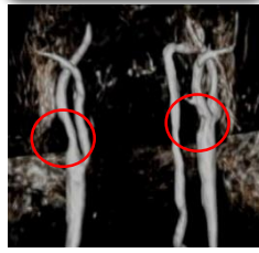
頸動脈狭窄 (脳梗塞の原因)