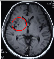
無症候性脳梗塞 脳腫瘍